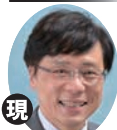
現 井上さとし ●参議院議員

市民と野党が力をあわせれば安倍政権を終わらせることができます。日本共産党は本気の野党共闘に力をつくし、市民の手で政治を変えるため、全力をつくします。