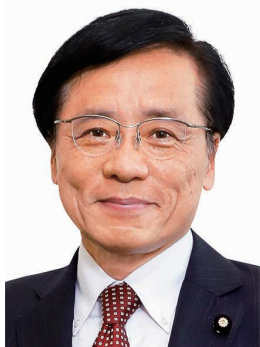
●参議院議員 4期 党参議院幹事長 (現) 井上 さとし

ご支援ありがとうございます。日本被団協のノーベル平和賞受賞の感動の中で迎えた参院選の年。被爆80年でもあり被爆2世として核兵器廃絶を高々と掲げ比例代表で5期目をめざします。昨年は参院で質問回数・時間もトップで「三ツ星議員」の表彰を受けました。さらに政治を前に進め「憲法と命輝く日本」へ力を尽くします。よろしくお願ひします。